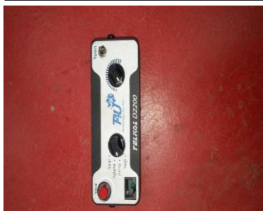
בקרה למגבר צופר ברכב מבצעי