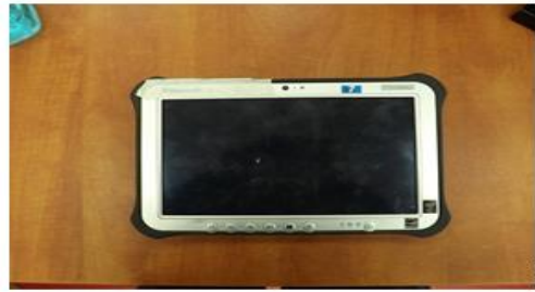
מידות טאבלט 20 X 28 X 2.5