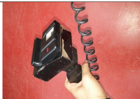
עמדת עגינה למדפסת הדס